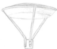
Korshavn Park LED